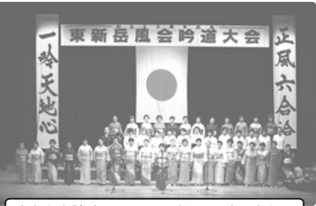
あなたも詩吟にチャレンジしてみませんか?

大会では、吟道大会へ夢と希望の詩(うた)物語と銘打ち、上杉謙信、直江兼続、河井継之助といった越後の歴史をたどる人物や越後の心を代表する人物、良寛の詩吟を中心に、ゲストには民謡の名人位、甚句日本一の小林よしえさんと民謡団体の雪栄会による「佐渡おけさ」「両津甚句」の披露。特に「佐渡おけさ」は「恋ヶ浦懐古」の吟詠と組んだ民謡吟なども会場から割れんばかりの拍手喝采を頂きました。