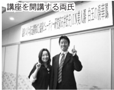
講座を開講する両氏

全国に美人の湯として名旅館と知られている月岡温泉「白玉の湯」ホテル華鳳で3月4日、5日の2日間で行われた「温泉健康 & 美容セミナー」。華鳳門を抜けて広がる6千坪の庭園と湯の香り漂う会場に、北は北海道から南は福岡の全国各地から多勢の方が集まりました。