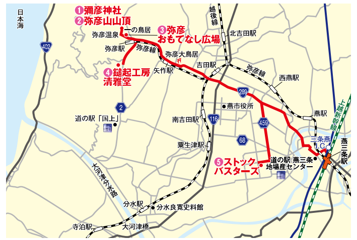
※運行の行程時間は目安となっております。また、ルートは当日の天候や交通状況等によって変更する場合があります。